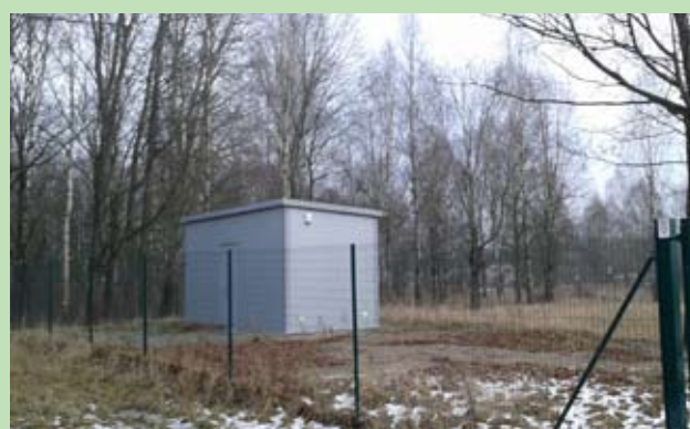
Urządzenie systemu wodociągu w Janczunach