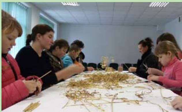
Sala Imprez w Kamionce