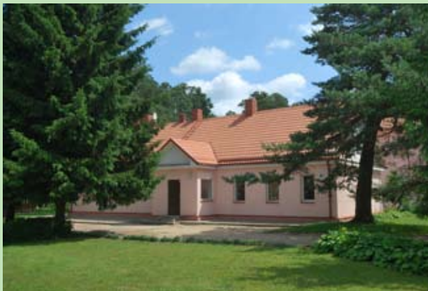
Szkoła Podstawowa w Podborzu