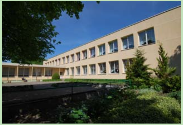
Żłobek – Przedszkole „Promyczek” w Ejszyszkach