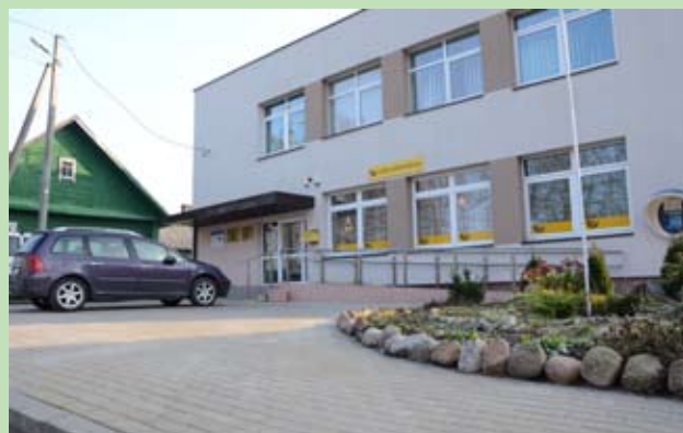
Budynek starostwa w Dziewieniszkach