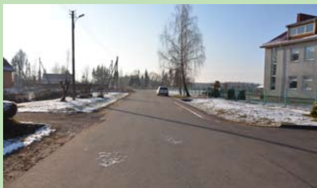
Ulica Nadziei w Czużekampiach