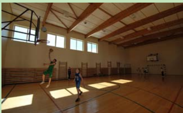
Sala sportowa w Szkole Podstawowej w Dajnowie