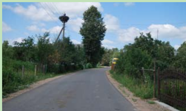
Ulica Kwiatowa we wsiach Giełuńce i Powary