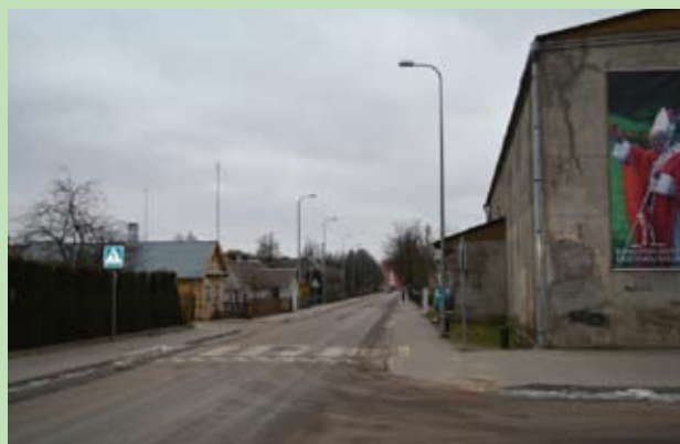
Ulica Jana Pawła II w Ejszyszkach