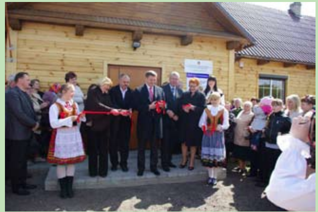
Otwarcie odremontowanej Sali Imprez w Rudnikach