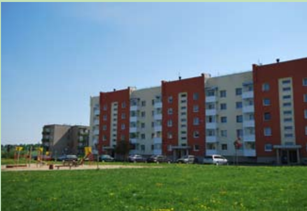
Blok Nr 35 przy ulicy Jana Pawła II w Ejszyszkach po renowacji