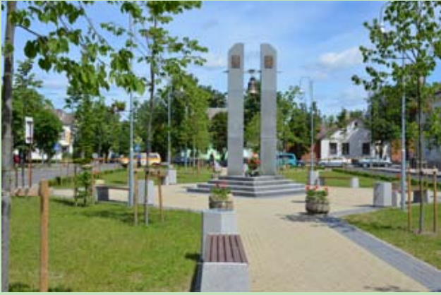
Skwer przy Placu Majowym w Ejszyszkach