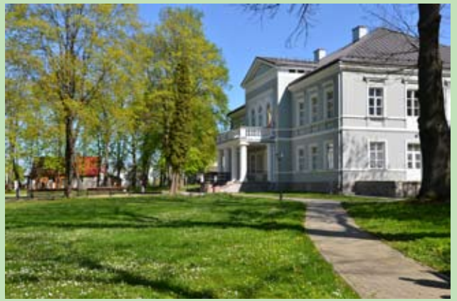
Szkoła Sztuk Pięknych im. S. Moniuszki w Solecznikach i park przy placówce