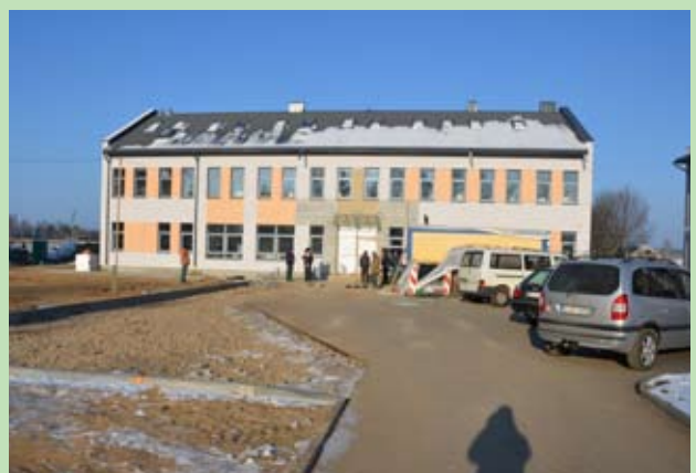
Budowa Domu Opieki nad Osobami Starszymi w Czuzekampiach