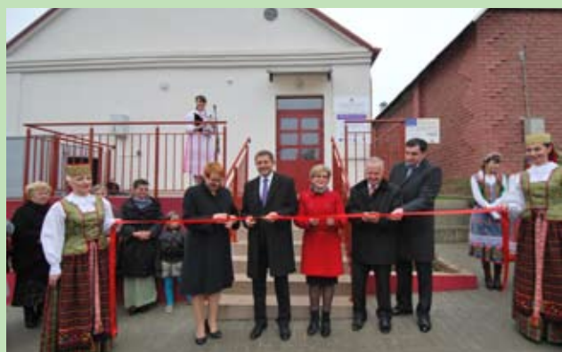
Otwarcie po remoncie Sali Imprez w Dziewieniszkach