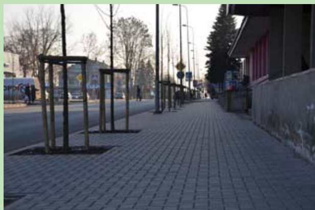
Chodniki na ulicy Wileńskiej w Solecznikach