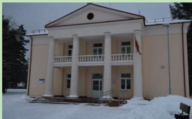
Centrum Kultury w Białej Wącej