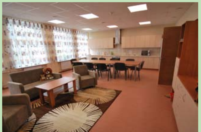
Modernizacja pomieszczeń Domu Dziecka w Solecznikach