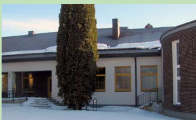
Uniwersalne Centrum Wielofunkcyjne w Janczunach