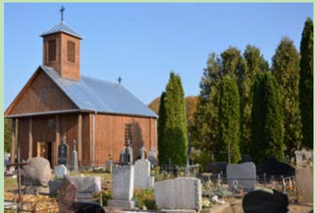
Odrenowowana kaplica cmentarna w Taboryszkach