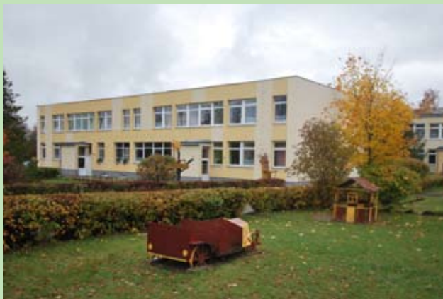
Żłobek – Przedszkole „Skowronek” w Solecznikach