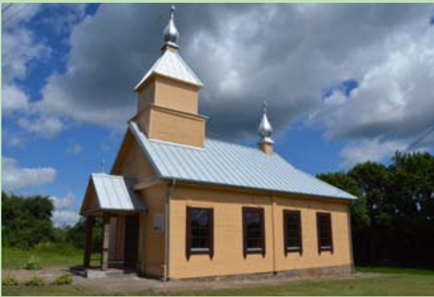
Odrenowowana cerkiew w Gaju