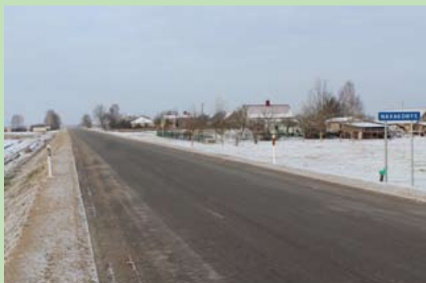
Odcinek drogi Wieżańce – Dajnowa – Podborze – Butrymańce