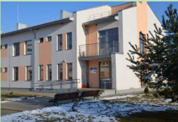
Dom Tymczasowego Zamieszkania w Czuzekampiach