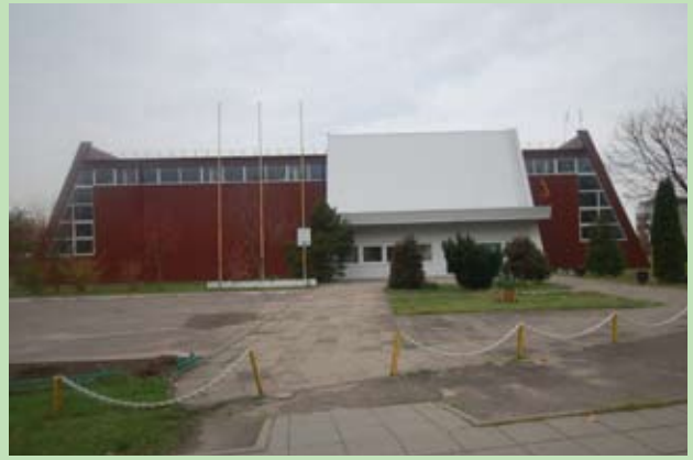
Budynek Szkoły Sportowej w Ejszyszkach po remoncie