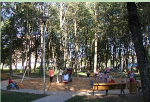
Plac zabaw w parku w Solecznikach