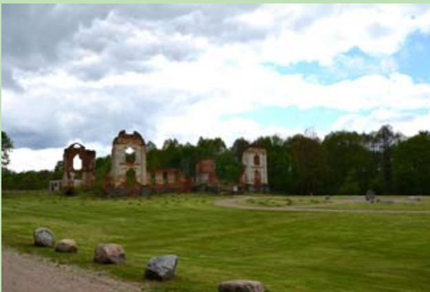
Dostosowanie Republiki Pawłowskiej do potrzeb turystów