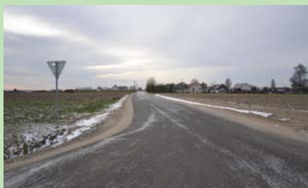
Ulica Nowa w Montwiliszkach