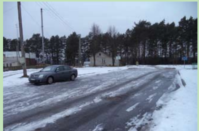
Parking i ulica Szkolna w Poszkach