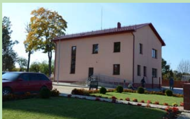
Dom Wspólnotowy w Koleśnikach